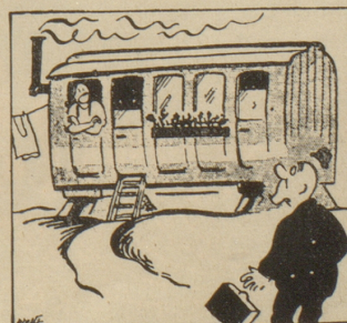
(Daily Express, London)