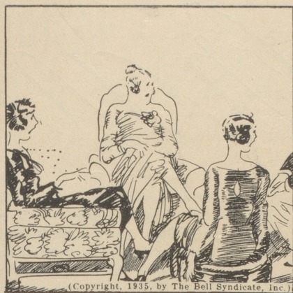
(Copyright, 1935, by The Bell Syndicate, Inc.)