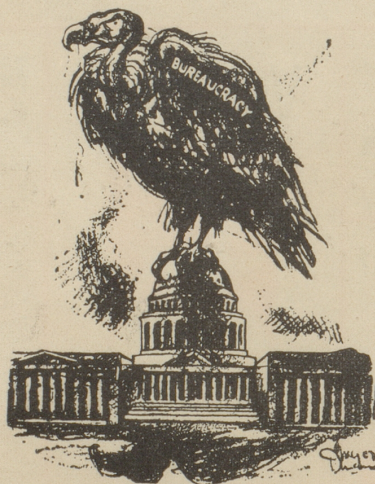
Bureaucratie der wahre Diktator in Washington Life, New-York