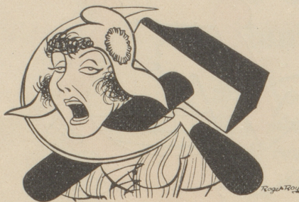
Frankreichs neuer Halsschmuck Le dernier cri de Paris