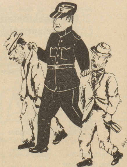
Dienst am Kunden