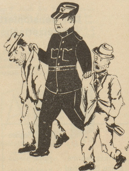
Dienst am Kunden