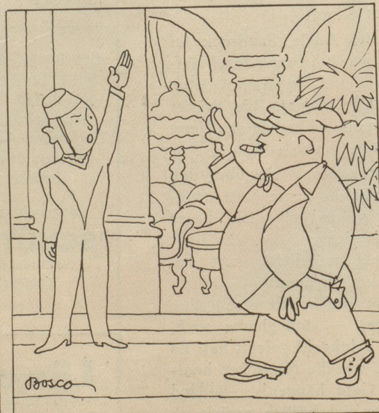
4. Jeder Deutsche wird vom Personal mit «Hei—itler» begrüsst. — M'r wänd dänn luege, ob 's nächst Jahr nöd meh Fröndi zue-n-is chömid!