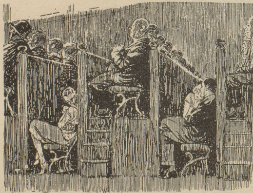
Neue Erfindungen Das Kino für Film- und andere Liebhaber.