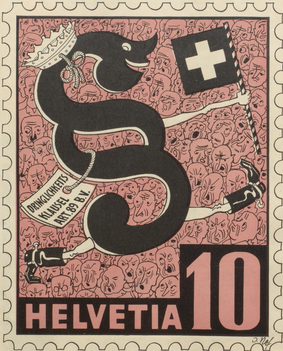
Aus der Serie: Neue Schweizer Briefmarken

Goldmännli BIERE sind wolfsmännli und brennend