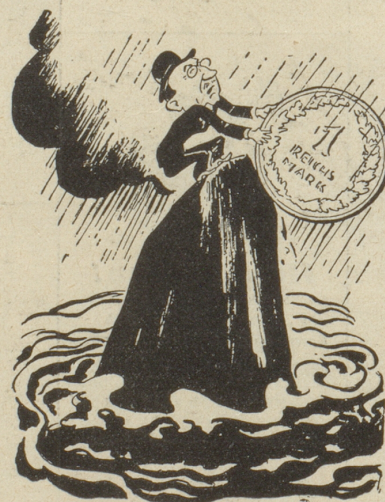
Doktor Schacht im Gleichgewicht Mucha, Warschau