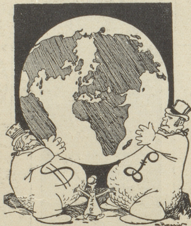
Der Franc passt sich an Mucha, Warschau