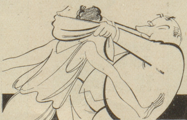
Zum neuen Presse-Gesetz in Frankreich Le Rire