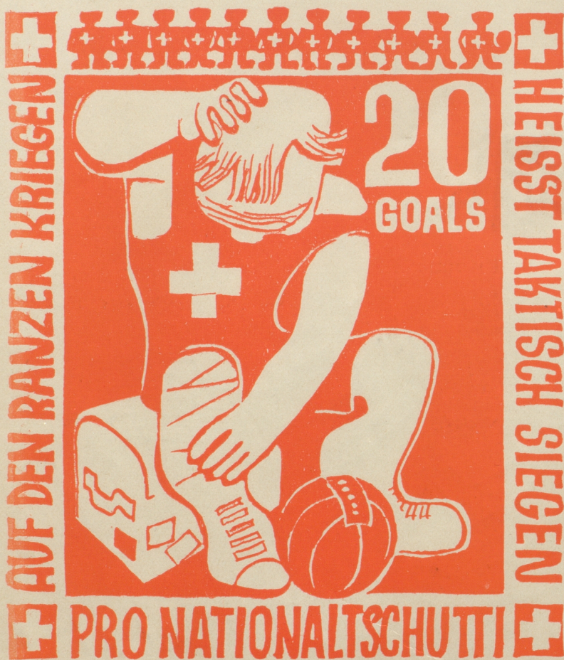
Aus der Serie: Neue Schweizer Briefmarken