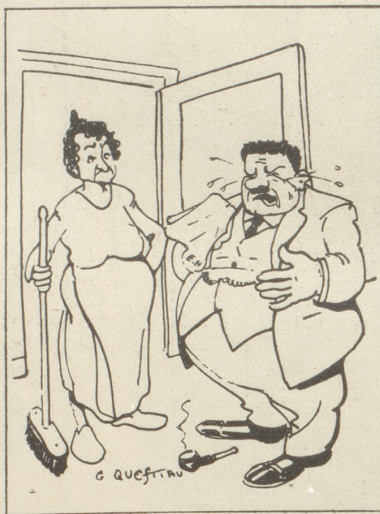
Die Aktion gegen den Lärm in Paris

«Um 10 Uhr abends, Herr Herriot, müssen Sie Ihr Gewissen zum Schweigen bringen!»