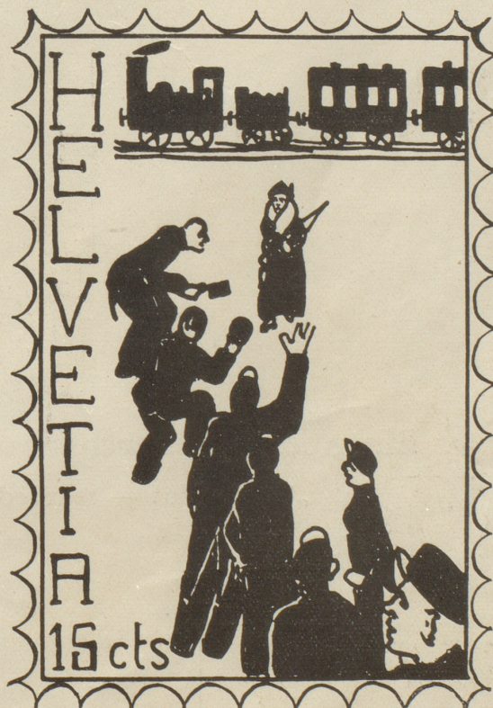
Empfang der Fremden