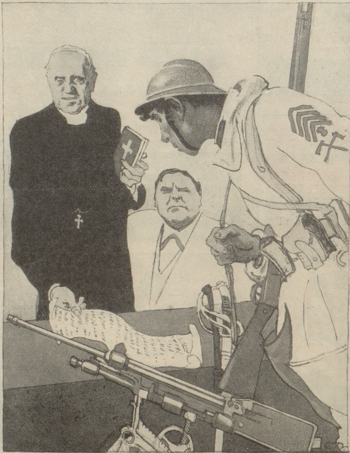
„Ein gutes Gewissen ist ein sanftes Ruhémittel! Wenn du deine Schulden bezahlst, stoff alles für Rüstungen auszugeben, wirst du dich gleich wieder sicher fühlen.“

Frankreich und der amerikanische Gläubiger (E. Thöny)