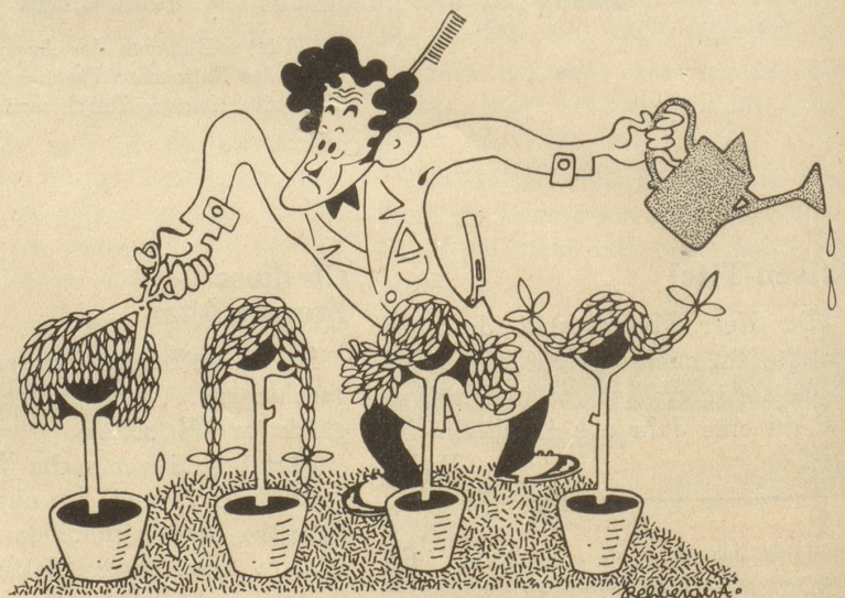
Der Frisör als Gärtner

Mein Wunderdoktor, der mich nun schon elf Jahre lang erfolgreich gegen chronischen Cognac- und Kirschgeruch behandelt, rät der Dame, an jedes Haar einen Backstein zu binden. Durch den Zug werden die Haare länger und dünner. Der einzige Nachteil sei der, dass die Haare eventunell (so sagt er) zu lang werden, aber dann könne man sie ja abschneiden. Das muss jedem einleuchten.