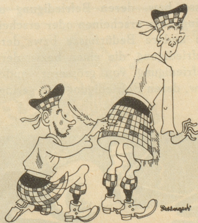
Die geizigen Schotten raten Kreuzworträtsel.