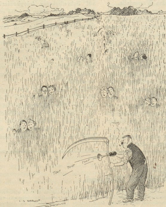
Eine neue landwirtschaftliche Erfindung

Der kleine Franz: «Säb isch ihre Maa, Herr Lehrer!» Febo