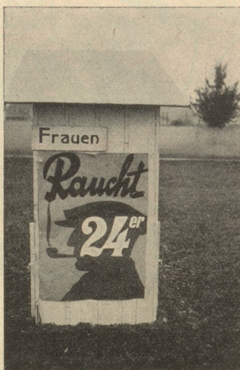
Hinter den Kulissen des Flugmeetings