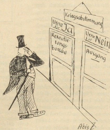
Der Rüstungsmagnat: «Ja, wens keinen dritten Weg gibt, dann nein!»