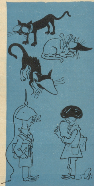
6. darum, verdunkelt die Katzenaugen, leitet die Geistesblitze ab, — bannt und verdunkelt sie durch Auflegen von eidgenössischem Pumpnickel.