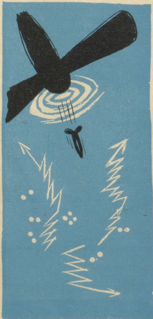
4. Die Katzenaugen und die Geistesblitze der Verdunkelungsfanatiker ...