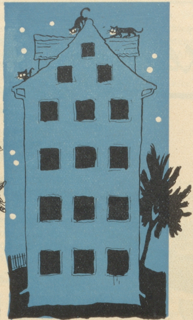
3. Ist jetzt verdunkelt? — nein! —