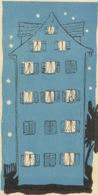
1. Die sorglosen Zeiten sind vorüber.