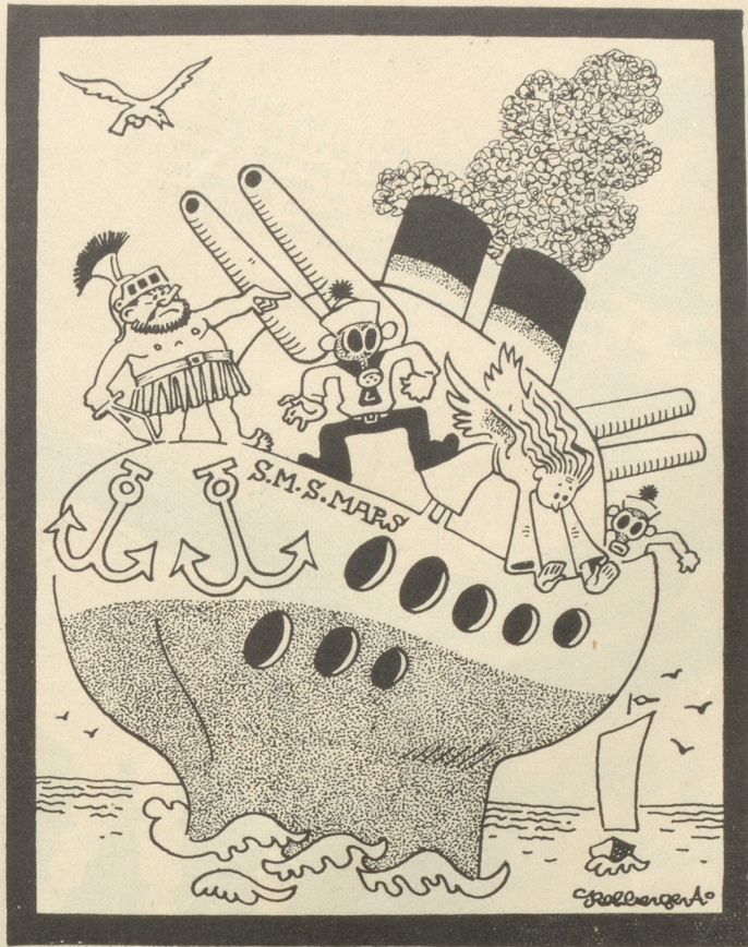
Der blinde Passagier.

Diesen Bericht hatte ein für technische Probleme interessierter Niederländer oder Belgier, der im 17. Jahrhundert als Missionar nach China ging — sein Name war Ferdinand Verbiest — gelesen. Er erlangte Zutritt zum Hofe des damaligen chinesischen Kaisers Kang-Hi und erkundigte sich bei ihm, ob die Nachricht auf Wahrheit beruhe. Kang-Hi bestätigte das so unfaßbar Scheinende; er stellte Verbiest die kaiserliche Bibliothek zur Verfügung. Und hier fand der Missionar in der Tat detaillierte Beschrei-