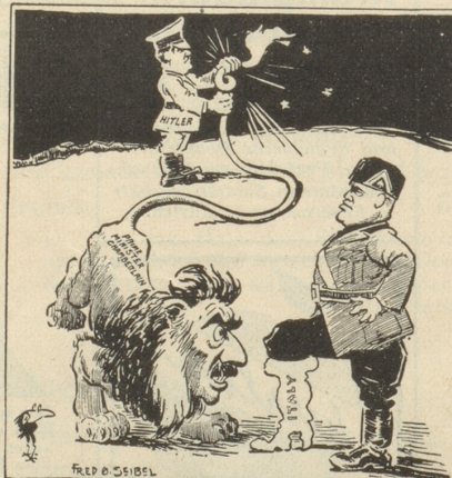
Von der Kunst, einem Löwen einen Knopf in den Schwanz zu machen.