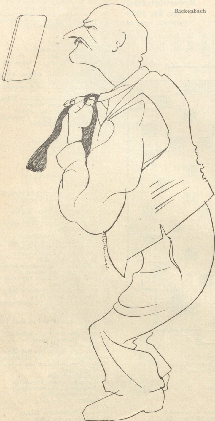
De Vatter mueß as Telifon