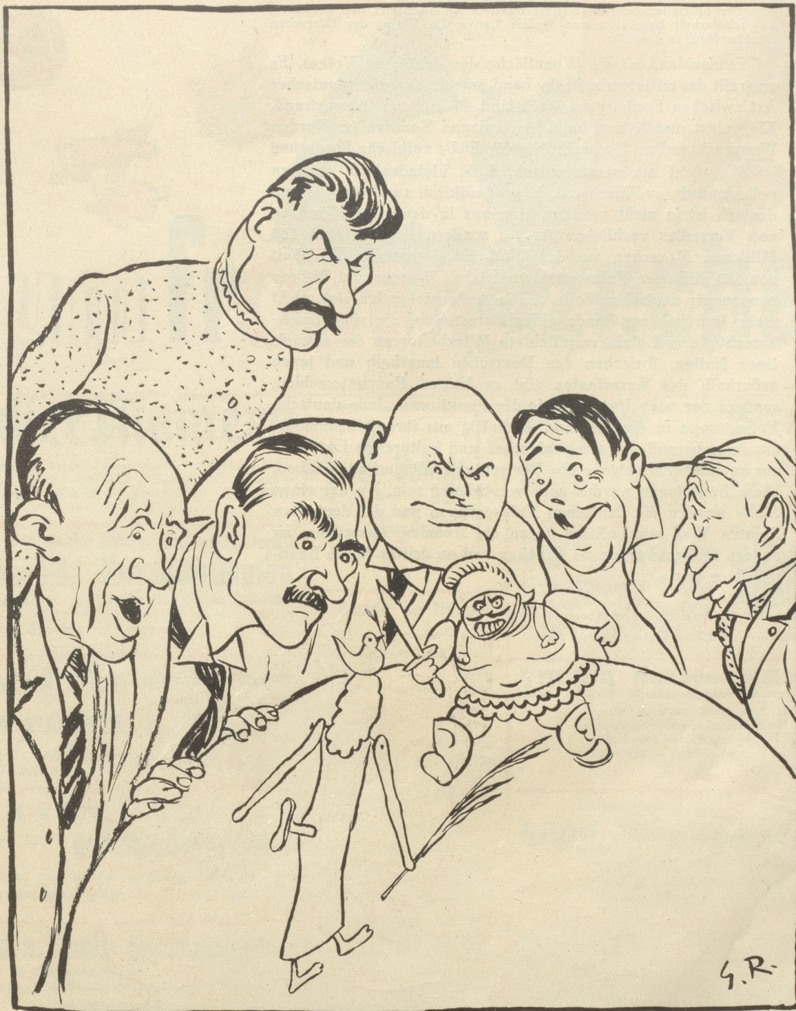
Zwei aufgezoene Puppen — — welche surrt zuerst ab?