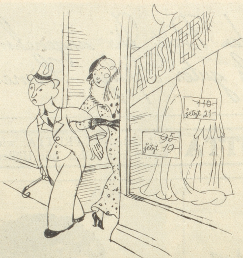
Wo die Gattin nicht vorbeigehen kann