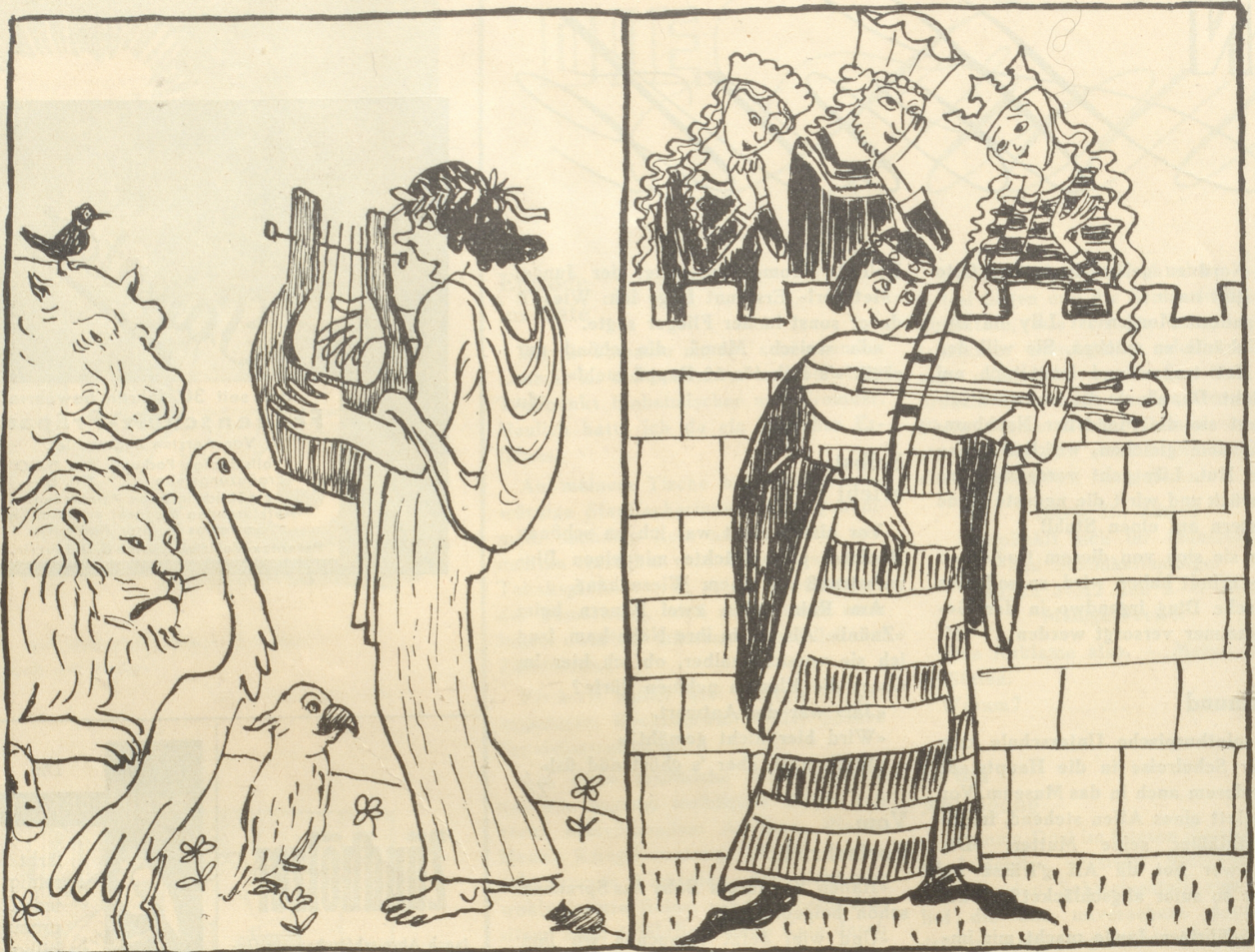
Orpheus zähmte mit seinem Gesang die wildesten Tiere,