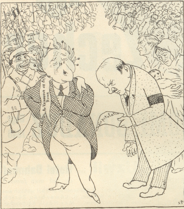
Poincaré: «Jetzt hat das deutsche Volk doch eingesehen, daß das Recht die Welt regiert!»