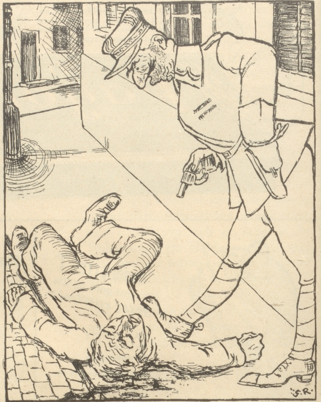
(Der französische Offizier, der einen Deutschen erschossen und einen andern schwer verwundet hat, wurde von dem französischen Gericht freigesprochen. Der schwer verwundete Deutsche erhielt ein Jahr Gefängnis.)

Amerikanische Justiz: «An ihrer Menschlichkeit könnte man verzweifeln, wenn sie nicht wenigstens käuflich wäre!»