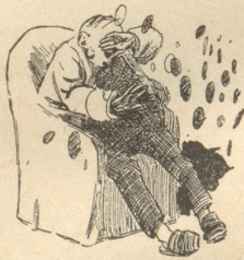
9) Fläcke vor de Auge,