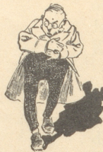
3) Stäche uem Härz,