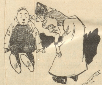
11) Stand uf, alte Löli — gang mer ändli go Chole hole!»