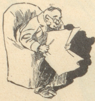
1) Prezis was ich scho lang gspüre: