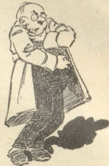
6) Angina und Katarrh,