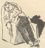
2) furchtbari Müdigkeit,