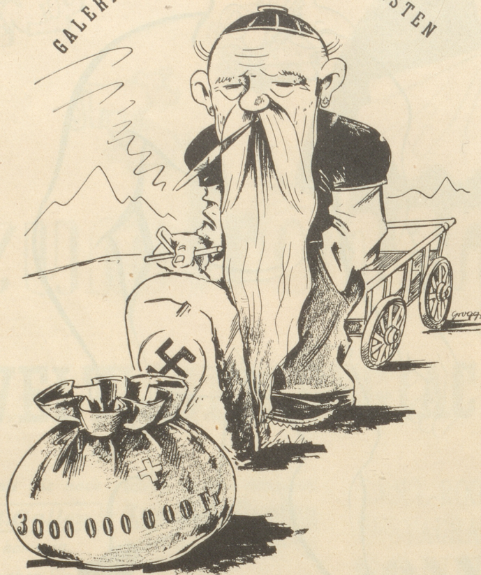
Der gute Mann, der immer noch etwas abholen möchte!