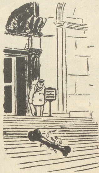
Begebenheit vor dem Naturhistorischen Museum