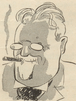
Der Weber-Stumpfen fehlte mir. Das war es. Und jetzt rasch zum Bier.