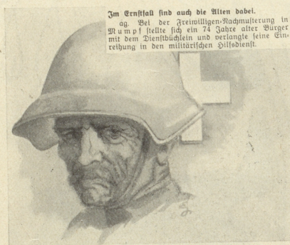
... hast noch der Söhne ja! Isler

Es ist furchtbar, wenn ein Redner immer wieder dasselbe sagt und es nicht weiß; schlimmer aber, wenn er es weiß. Rü.