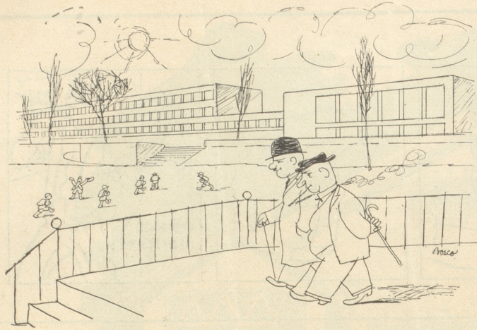
Zur Verlängerung der Rekrutenschulen. «Jä nu — me macht jetzt ja alli Schuele länger!»