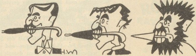
Wie man in Berlin die Verwandlung Chamberlains auffaßt. (Le Canard. Paris)

ab. Nach 3 Jahren ermäßigt sich die Prämie zuerst um 9%, später um 12%, nach 5 Jahren um 15%, usw.