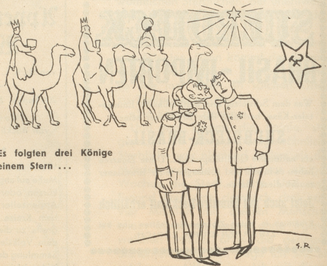
Es folgten drei Könige einem Stern ...