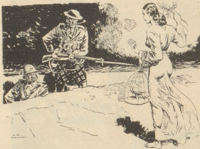
Die Vorposten «Hast Du den Passierschein, unterschrieben von Chamberlain!» Italienische Satire aus «420, Florenz»