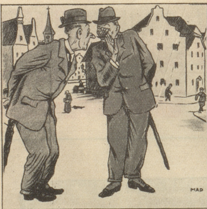
Französische Satire: «Wird der Führer in Holland eindringen!» «Ja, später, um nach Doorn zu gehen!» Marienne