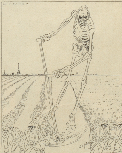
Deutsche Satire aus dem «Simplicissimus»

Fort mit der «Ueberzeugungstreue» — Sofern's rentiert, so nimm das Neue! Die Signatur der «großen» Zeit Ist die Charakterlosigkeit! Grue.