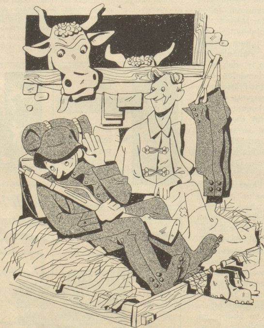
Der Mann mit dem Alarmkomplex