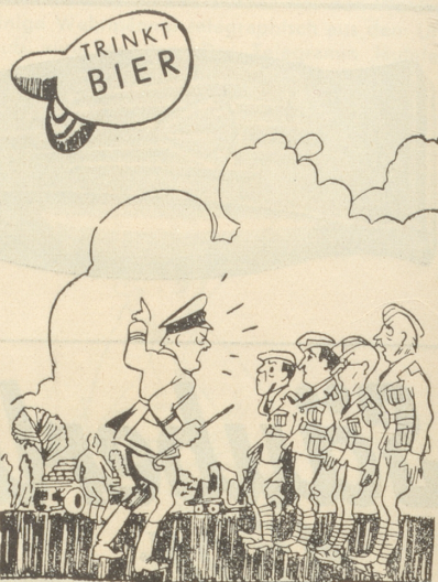
«Wer hät jetzt das mit der cheibe Reklame wieder gmacht?!»