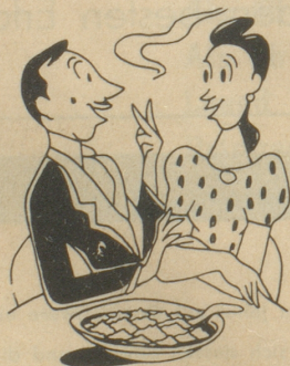
De Vater aber fasst en B'schluss: Roco-Ravioli sind en G'nuss, Gäll Frau, die bringscht so duftig frisch All Wuche zweimal uf de Tisch!