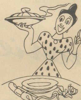
Wänn's Vaterlis Geburtstag isch, Git's öppis b'sunders uf de Tisch.