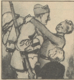
„Gelt, gib Sorg zu Dir, die kalten Nächte tun Dir nicht gut. Dass Du mir auch nur nicht zu viel rauchst!“