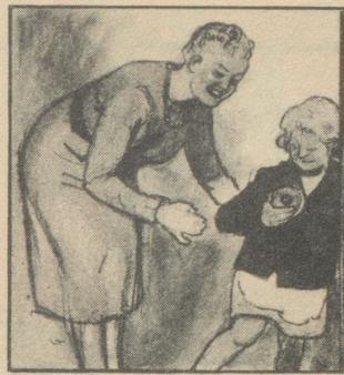
„Schnell, spring dem Vater nach und bring ihm noch die Schachtel Gaba.“