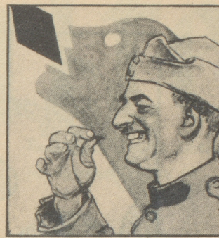
So ist's recht, so gibt es keine Erkältung und keinen Raucherkatarrh. Gaba beugt vor.