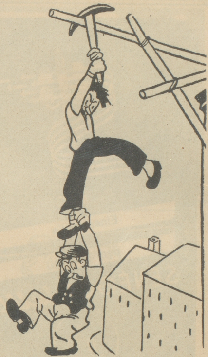
«Lah mr 's Bei gah, süsch hau dr de Pickel uf de Schädel!» (Das illustr. Blatt)