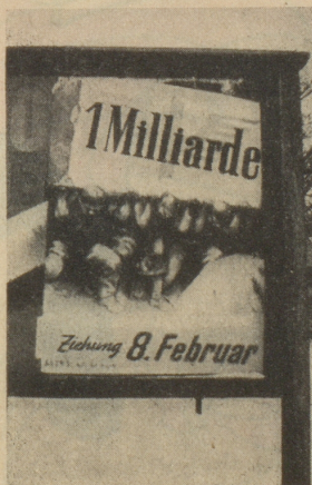
Isch das nüd Ufschnitt?