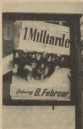
Isch das nüd Ufschnitt?