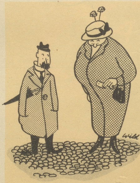
Die kleinen Servelats