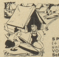
Am Wochenende ziehe aus Mit Deinem eignen Bett u. Haus

Schließlich hat es der gute Herr Professor satt. Und als die Frau sich wieder einmal in der erwähnten Weise ausdrückt, herrscht er sie zornig an: «Jetz säg mer nüme immer: de Herr Ding! Wennst scho sy Name nid chansch stigle, so säg wenigstens: de Herr Substantiv!» fis