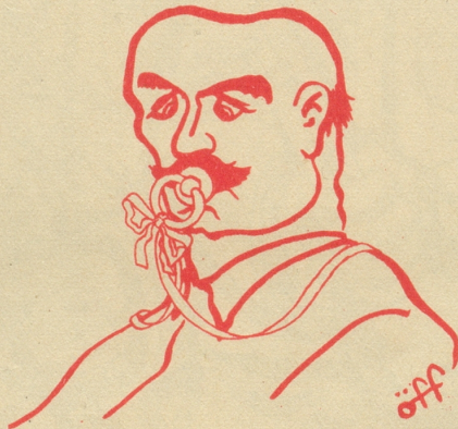
Gegen säuglingshaftes Politisieren!

Unerwünschte Ratschläge wachsen wie ein Unkraut auf dem Boden mensch- licher «Kultur» . . . W. F.