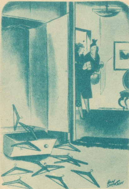
«Es nimmt mich wunder, ob Harry über den Streit von heute morgen hinweggekommen ist.» — Englischer Humor aus «The Humorists»