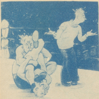
«Kann hier jemand einen Seemanns-Knoten lösen?» (Humorist, London)