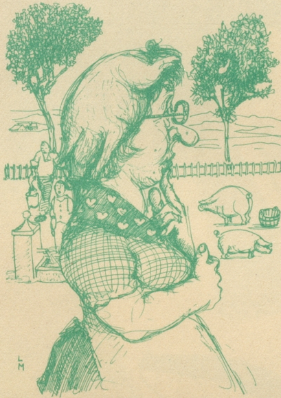
Die u-gmerkig Magd «Wieso säged s' au immer, mir hebed drüü Soue?»

Heute sagt man: «Der brave Mann denkt an sich, selbst zuletzt.» Hagel