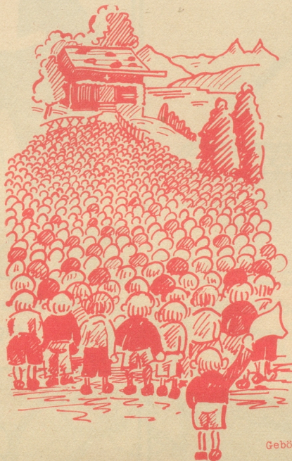
„Von ferne sei herzlich begrüßet!“

Ich nehme die Photo in Empfang und bedanke mich. Nun war der verehrte Mann nichts weniger als eine Filmheldenschönheit. Sein vielsagendes Lächeln jedoch und das überlegene und zugleich gütige Wesen ließen la sale gueule ganz vergessen. -e-